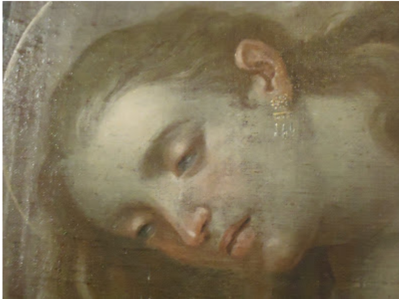
Detalle de gran belleza de la Magdalena