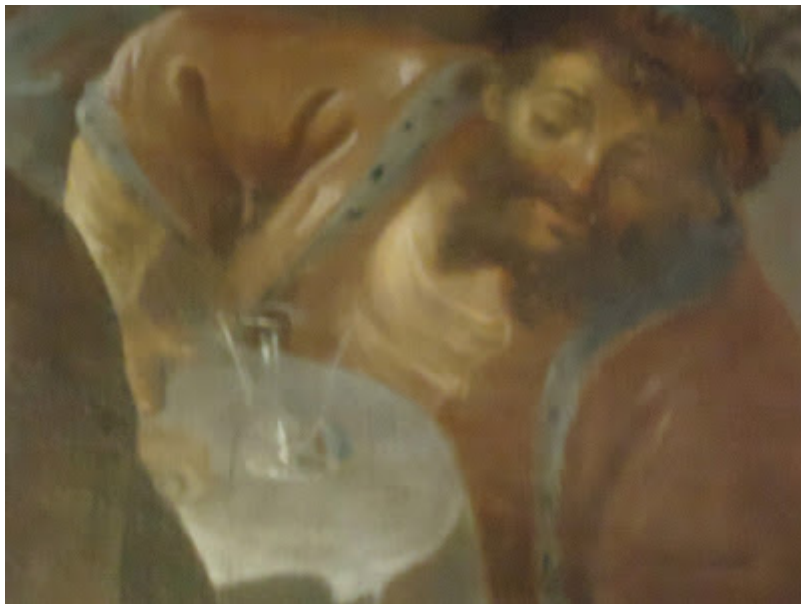
Gran realismo en el detalle del vaso