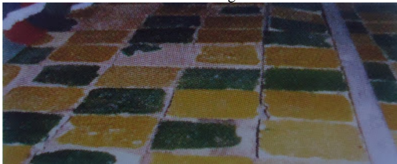
Pavimento de barro vidriado.

Su estructura es singular, ya que no sigue el esquema general de las ermitas de