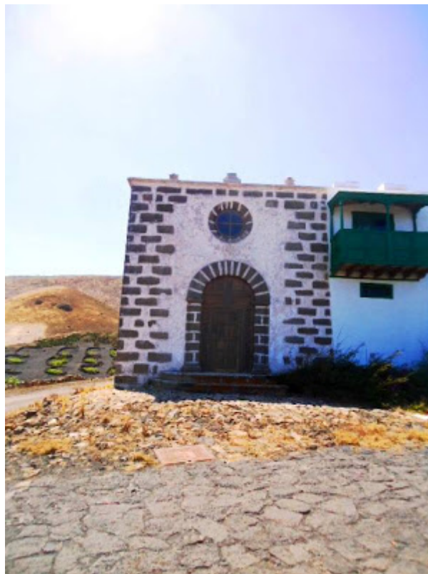
Ermita de la Magdalena

La Ermita de la Magdalena, en Conil, es una de las más hermosas capillas privadas que se conservan en la isla de Lanzarote. De gran belleza, fue erigida a finales del siglo XVIII, y gozó desde entonces de una gran popularidad, pues antes de construirse la de Masdache y, posteriormente, la de Conil, se celebraban en ella las fiestas de la Magdalena, las cuales llegaron a ser las terceras en importancia de la isla, coincidiendo su celebración con el momento de probar las primeras uvas.