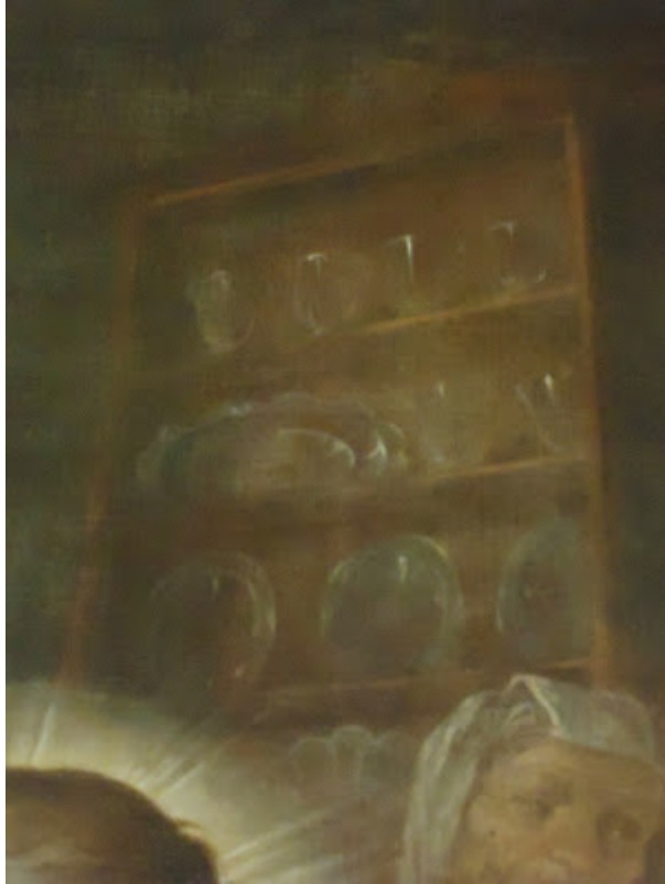
Espectacular tratamiento del vidrio