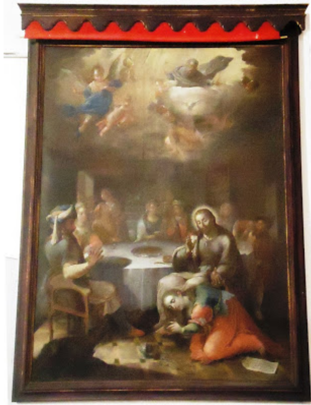
"La Magdalena ungiendo los pies de Cristo"

Lanzarote, pues no presenta espadaña ni cruz en su fachada, y su techumbre es plana y no inclinada. En el interior conserva dos tesoros: un pavimento de azulejos vidriados amarillos y verdes (únicos en la isla) y un cuadro de "Magdalena ungiendo a Cristo" de gran calidad, atribuido al reconocido pintor canario Juan de Miranda. Esta obra, de considerables dimensiones, puede hoy apreciarse en el Museo de Arte Sacro de Teguiise, en donde se expone cedido por sus propietarios.