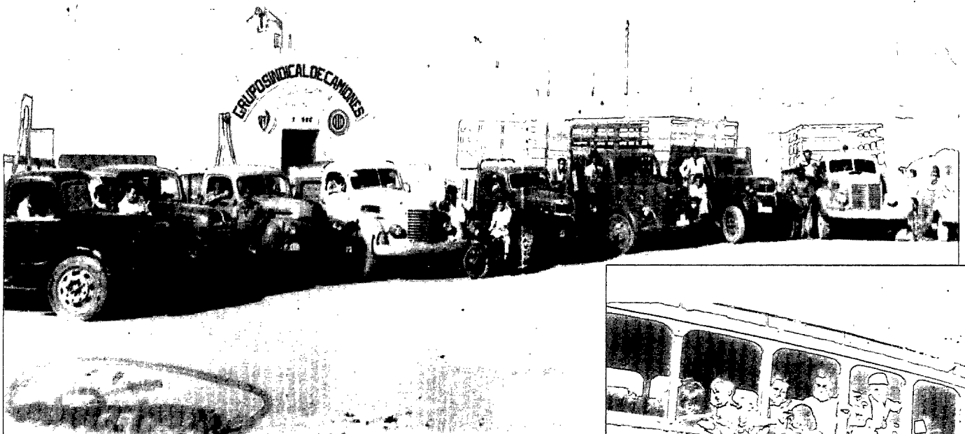
Conductores y vehículos del Grupo Sindical de Camiones.